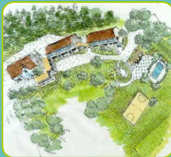
Vue aérienne colonie Saint-Gervais Dessin par H.G. Lesemann Architectes FAS